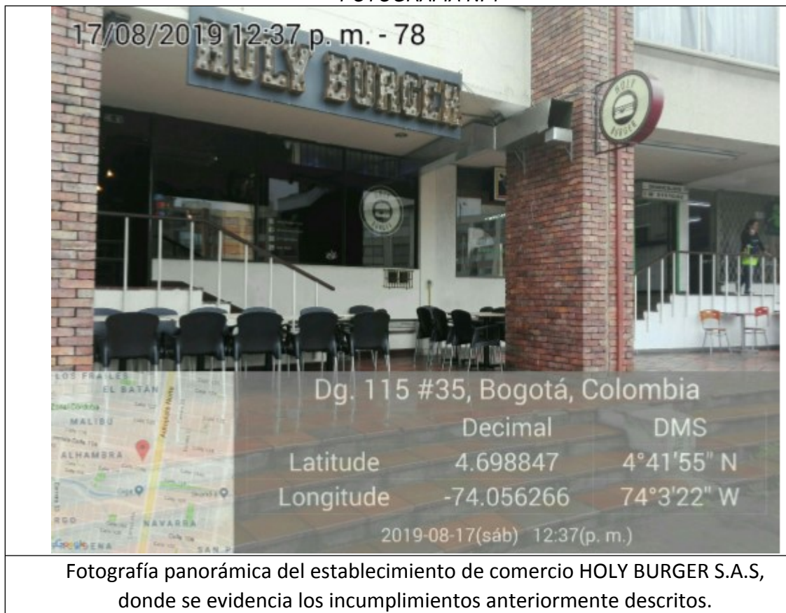
FOTOGRAFIA N. 2