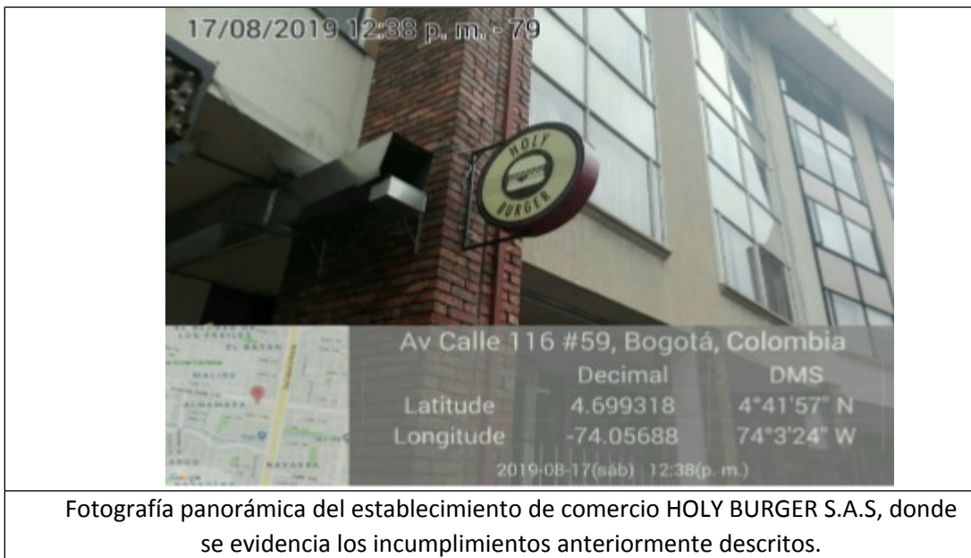
FOTOGRAFIA N. 3