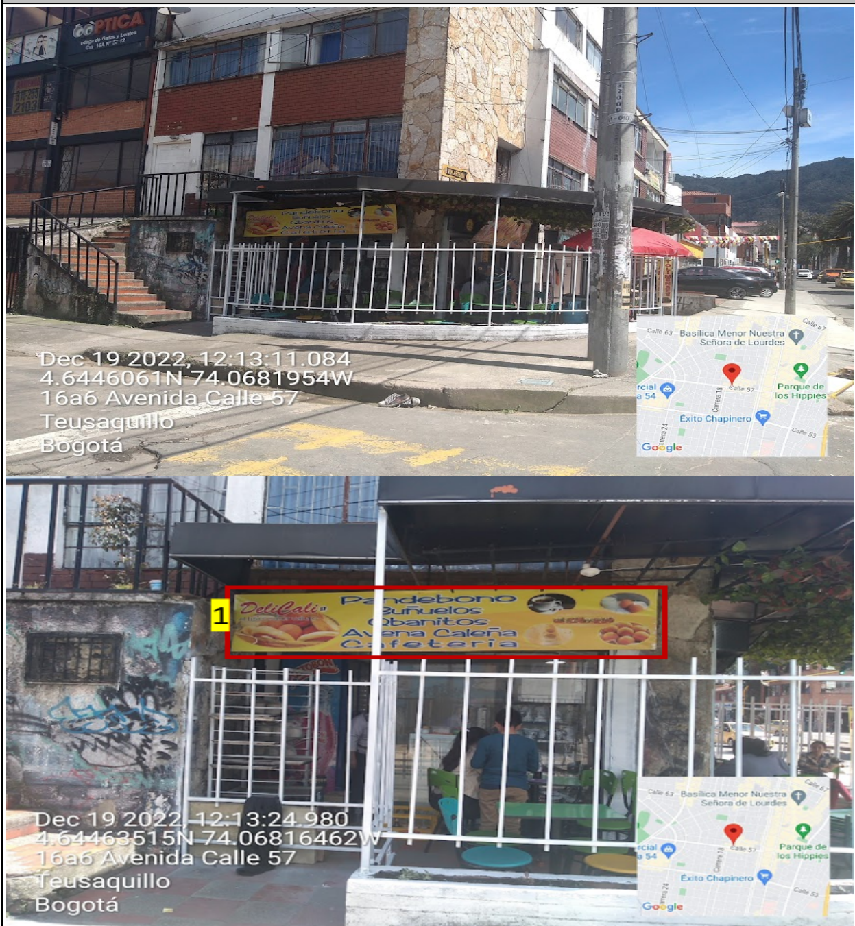
Fotografía No. 4

Fachada con orientación visual hacia la CR 16 A, en la que se puede evidenciar: un (1) elemento publicitario tipo “aviso en fachada” instalado sin contar con el registro ante la Secretaría Distrital de Ambiente, identificado con el número 1.