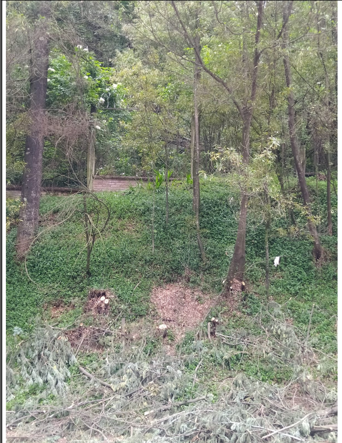
Foto 3. Vista general de Acacias evaluados en la dirección KR 3 26 B 61.

Secretaría Distrital de Ambiente Av. Caracas N° 54-38 PBX: 3778899 / Fax: 3778930 www.ambientebogota.gov.co Bogotá, D.C. Colombia