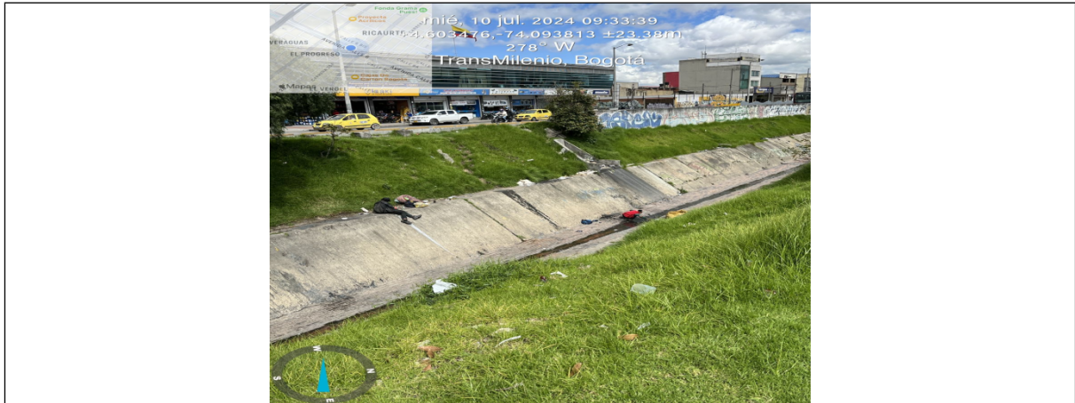
Fuente: visita técnica de seguimiento y control del 12 de junio de 2024.

SECRETARÍA DISTRITAL DE AMBIENTE Folios: XXXX. Anexos: XX. Radicación #: XXXXXXXX Proc #: XXXXXX Fecha: XXXX-XX-XX XX:XX Tercero: XXXXXXXX - XXXXXXXXXXXXXXXXXXXXXXXXXXXXXXXXXXXX Dep Radicadora: XXXXXXXXXXXXXXXXXXXXXXXXXXXXXXXXXXXX Clase Doc: XXXXXXXX Tipo Doc: XXXXXXXX