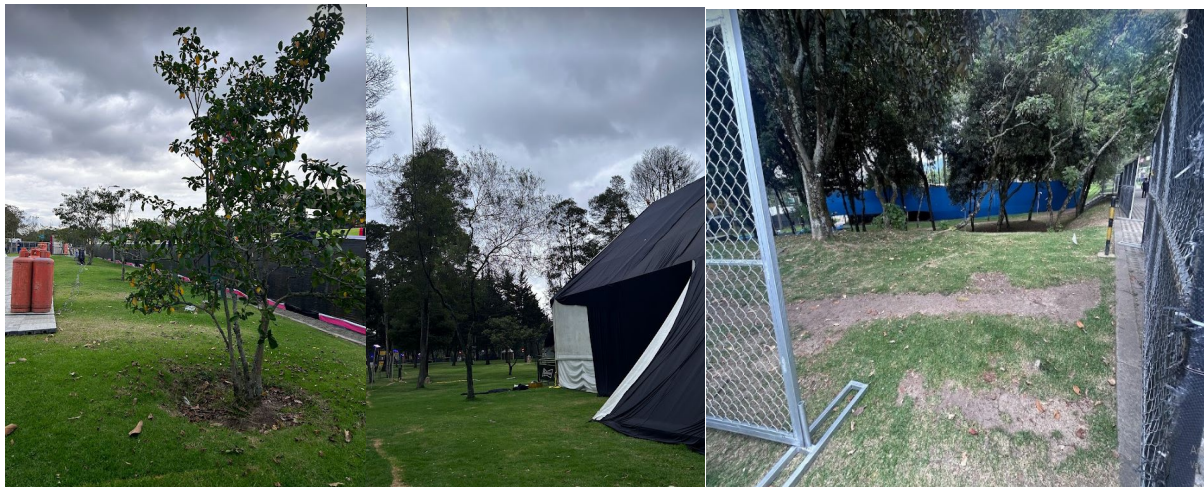
Fotografías 1 a 3. Recorrido de control previo al evento, realizado el 19 de marzo.

Durante el evento: un (1) representante de la entidad quien asistió a cada una de las reuniones del Puesto de Mando Unificado (PMU) de la organización del evento, fueron informadas novedades o hallazgos en torno al arbolado. Aquellos fueron registrados para su posterior verificación por parte de los profesionales competentes.