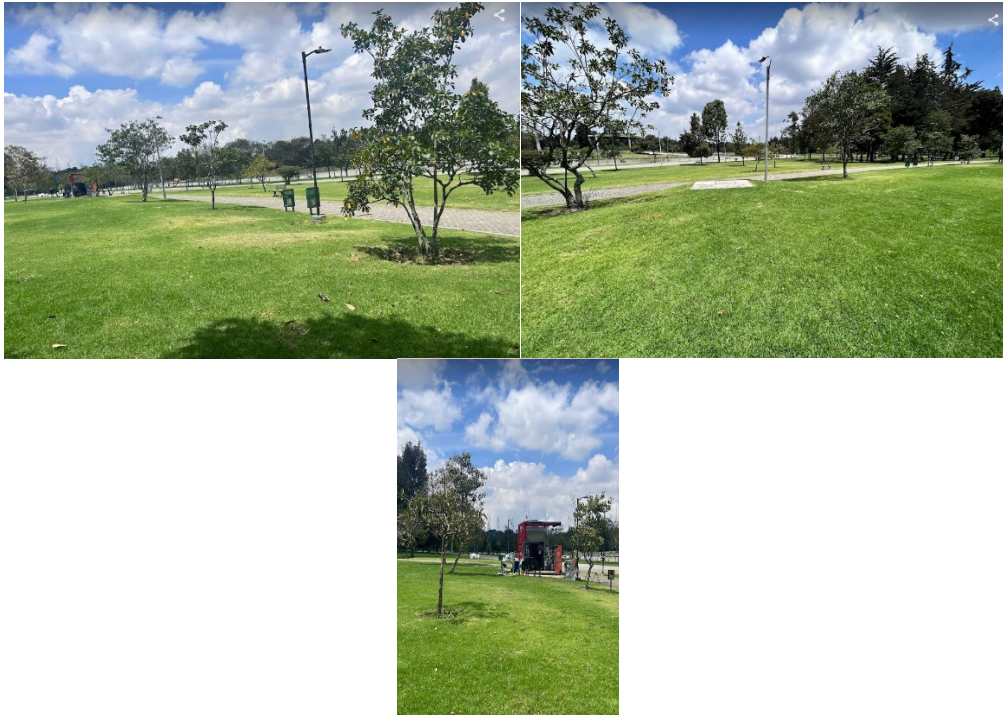
Fotografías 1 a 3. Recorrido de control previo al evento, realizado el 04 de marzo 2024.

SECRETARÍA DISTRITAL DE AMBIENTE Folios: XXXX. Anexos: XX. Radicación #: XXXXXXXXXX Proc #: XXXXXX Fecha: XXXX-XX-XX XX:XX Tercero: XXXXXXXXXX - XXXXXXXXXXXXXXXXXXXXXXXXXXXXXXXXXXXX Dep Radicadora: XXXXXXXXXXXXXXXXXXXXXXXXXXXXXXXXXXXX Clase Doc: XXXXXXXX Tipo Doc: XXXXXXXX