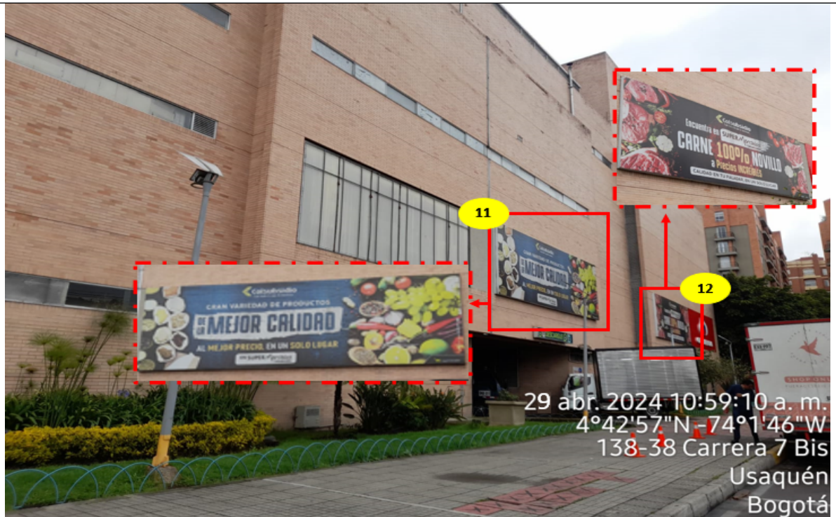
Fotografía No. 8

Para la fachada con vista hacia la CR 7 BIS del CENTRO COMERCIAL PALATINO – PROPIEDAD HORIZONTAL , se evidencian dos (02) elementos PEV identificados con los números 11 y 12.