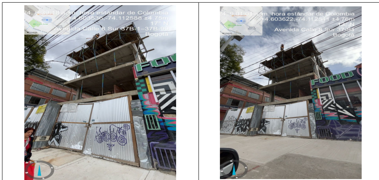
Fotografías No. 1 y 2. Fachada de la obra ubicada en la calle 8 Sur N 37-94, Localidad Puente Aranda.

Por consiguiente, en el marco de lo establecido en el artículo 34° del Decreto 948 de 1995, esta entidad le solicita como responsable de la obra, realizar la instalación de mampara y cerramiento de fachada como mecanismo de control para evitar la dispersión de partículas en suspensión.