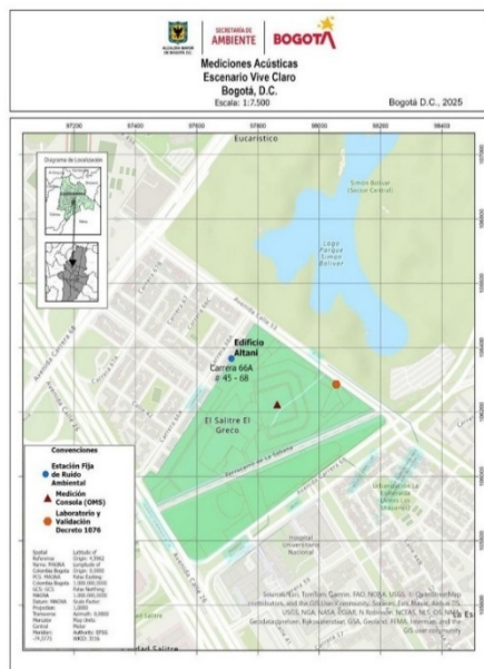
Imagen 1. Ubicación de la estación fija de monitoreo de ruido en el Edificio Altani

Por otro lado, en el marco del evento GUNS N' ROSES y posteriores, la estación fija de monitoreo de ruido ambiental fue instalada en el HOSPITAL UNIVERSITARIO NACIONAL , ubicado en la CL 44 No. 59 - 75 .