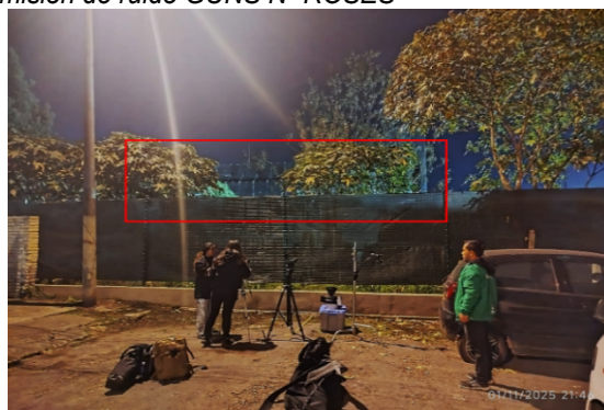
Fotografía 3 punto de medición SHAKIRA BOGOTA 2025 frente al Sistema de Control y Mitigación implementado ubicado en la CL 45.