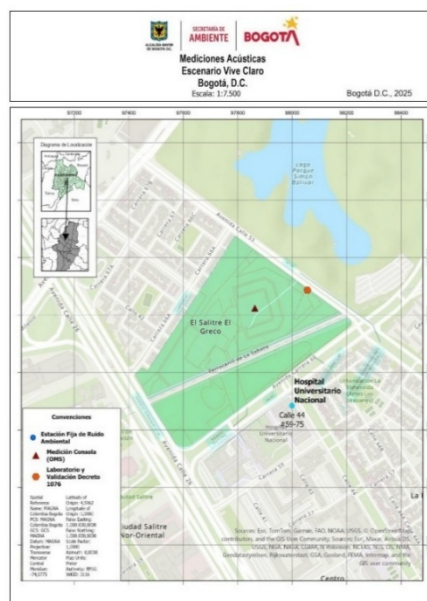
Imagen 2. Ubicación de la estación fija de monitoreo de ruido en el Hospital Universitario Nacional