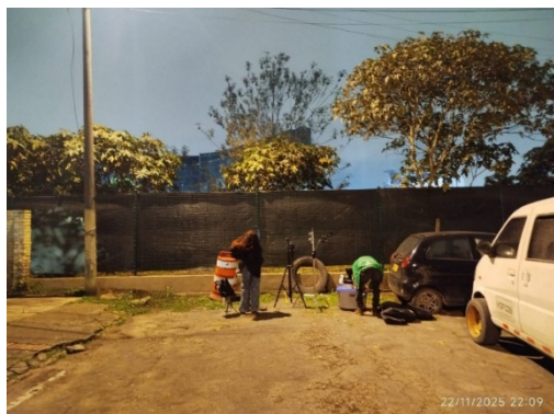
Fotografía 4 Vista del punto de medición BLESSD BOGOTA 2025 ubicado a una distancia de 1,5 metros de la fachada y una altura de 1,2 metros de la fachada sobre la CL 45