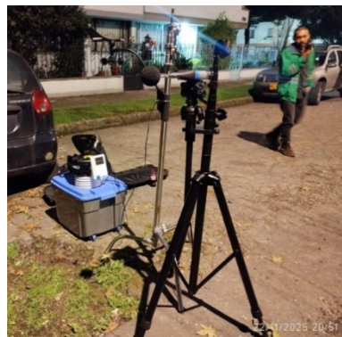
Fotografía 5 punto de medición BLESSD BOGOTA 2025 frente al Sistema de Control y Mitigación implementado ubicado en la CL 45.