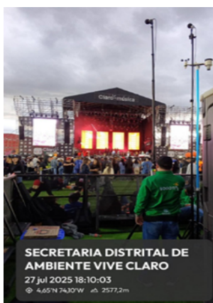
Fotografía 8. Mediciones al interior durante el concierto “Celebremos con Mamá y Papá - Jessi Uribe y Paola Jara”