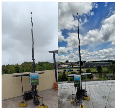
Fotografía 6 y 7. Mediciones al exterior mediante estación fija de monitoreo continuo de ruido ambiental en el Edificio Altani (izquierda) y en el Hospital Universitario Nacional (derecha)