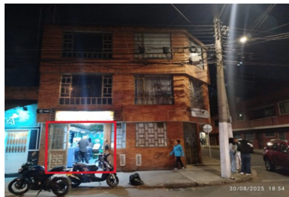
Fotografía No. 4. Registro de puerta abierta