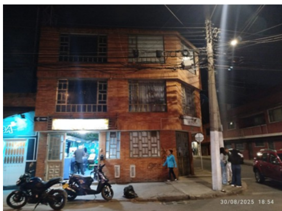
Fotografía No. 1. Vista general del predio objeto de seguimiento ubicado en la AC 66 No. 69 M – 04/06

A continuación, se presenta el registro fotográfico de la visita realizada: