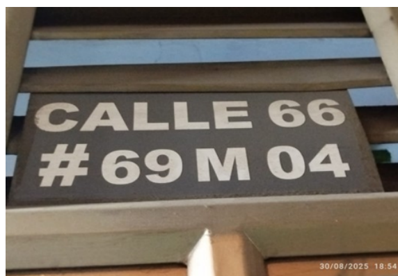
Fotografía No. 2. Nomenclatura expuesta en fachada