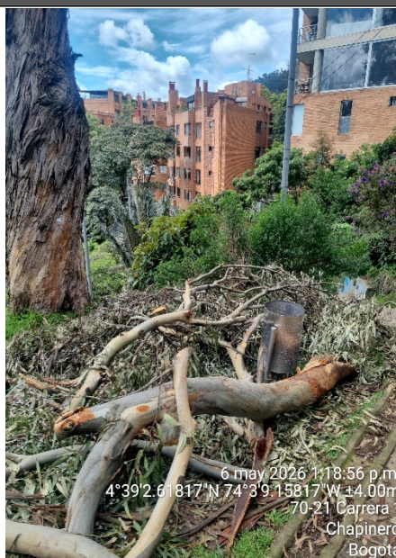
Foto 4. Vista general de los residuos vegetales.