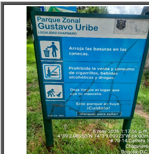
Foto 1. Placa de ubicación de la solicitud.