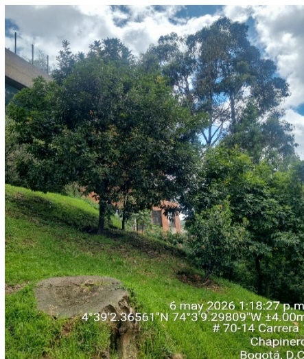
Foto 2. Vista general de los árboles de la zona.