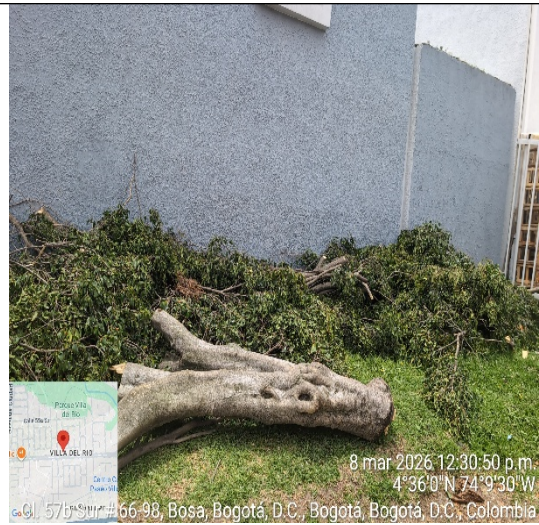
Fotografía 2: Intervención por parte de bomberos