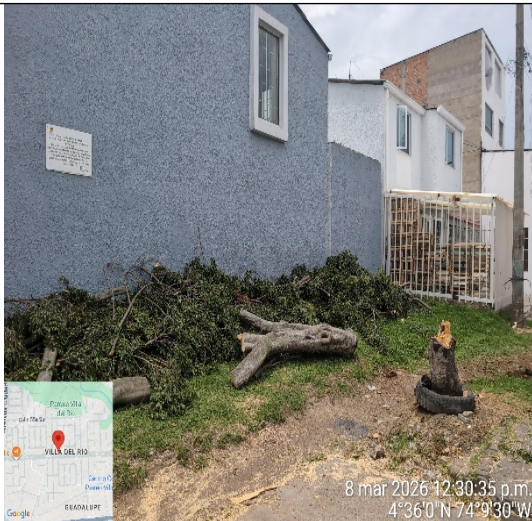
Fotografía 3: Residuos presentes en la zona