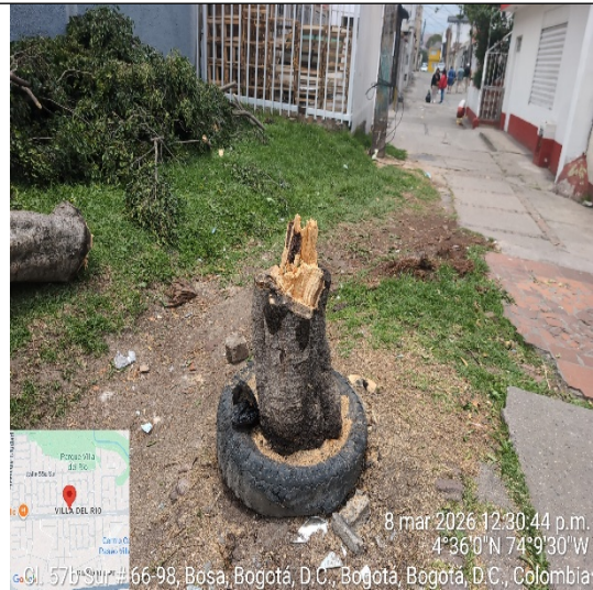
Fotografía 6: Tocón del individuo