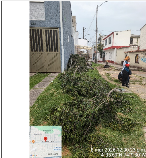
Fotografía 5: Residuos presentes en la zona

ALCALDÍA MAYOR DE BOGOTÁ D.C. SECRETARÍA DE AMBIENTE