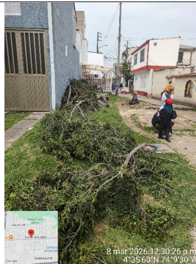
Fotografía 4: Residuos presentes en la zona