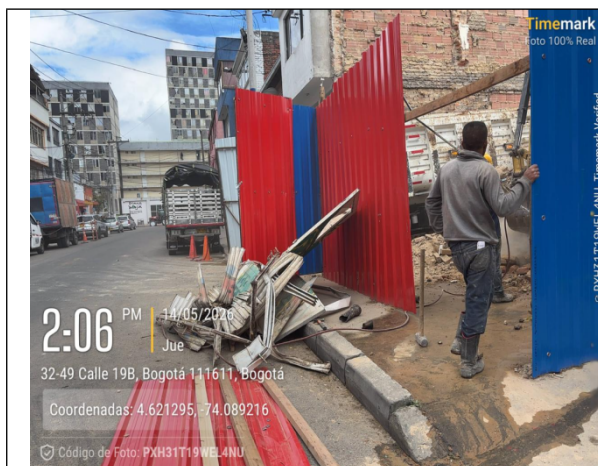
Fotografía No. 1 Residuos de demolición almacenados en espacio público.