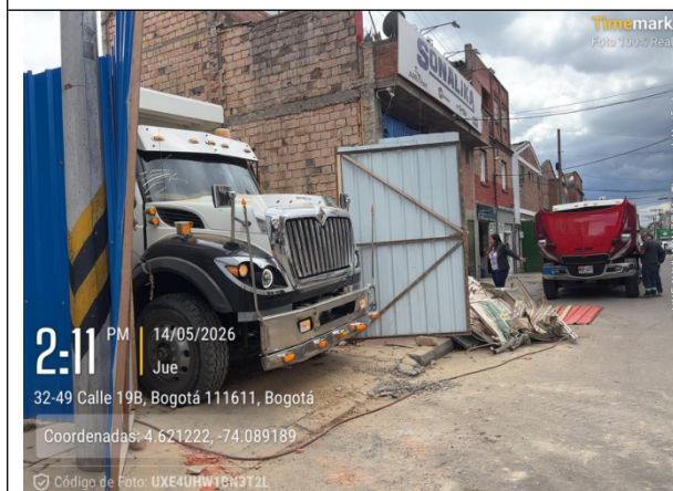
Fotografía No. 3 Cargue de residuos de construcción y demolición hacia el transportador.