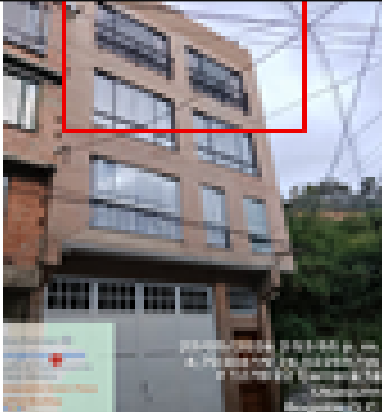
Fotografía 5. Pisos Construidos y terminados en la vivienda con dirección KR 1 E 127B 08.