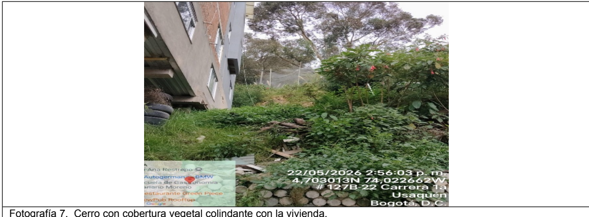
Fotografía 7. Cerro con cobertura vegetal colindante con la vivienda.

SECRETARÍA DISTRITAL DE AMBIENTE Folios: XXXX. Anexos: XX. Radicación #: XXXXXXXXXX Proc #: XXXXXX Fecha: XXXX-XX-XX XX:XX Tercero: XXXXXXXXXX - XXXXXXXXXXXXXXXXXXXXXXXXXXXXXXXXXXXX Dep Radicadora: XXXXXXXXXXXXXXXXXXXXXXXXXXXXXXXXXXXX Clase Doc: XXXXXXXX Tipo Doc: XXXXXXXX