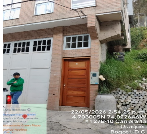
Fotografía 4. Ingreso de la vivienda, en relación con el registro fotográfico enviado (fotografía 3)