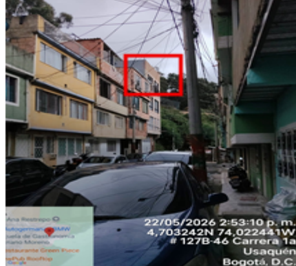
Fotografía 2. Obra construida y terminada, de acuerdo con lo evidenciado el día 22 de mayo de 2026, en visita realizada.