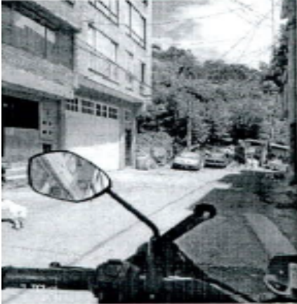
Fotografía 3. Evidencia del predio solicitado en el radicado SDA No. 2026ER103807 del 20 de mayo de 2026.