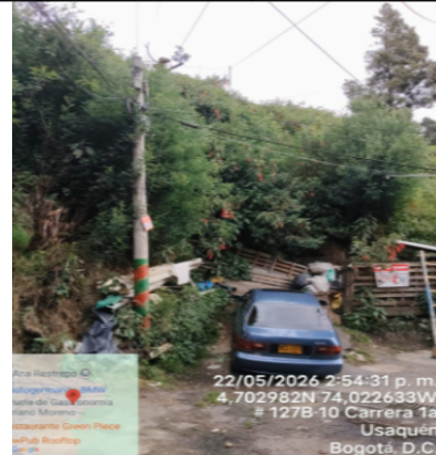
Fotografía 6. Cerro con cobertura vegetal colindante con la vivienda.