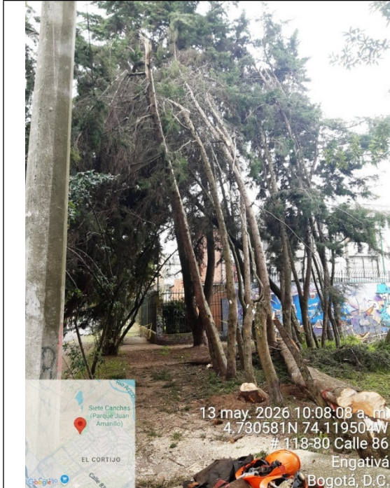
Fotografía 7. Vista general del árbol (objeto de la petición)

secas, partidas y pendulantes entrelazadas entre sí, el grado de inclinación hace que se encuentren sostenidos por otro individuo arbóreo de mayor porte.