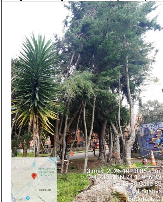
Fotografía 9. Vista general del árbol (objeto de la petición)