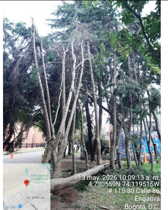
Fotografía 8. Vista general del árbol (objeto de la petición)