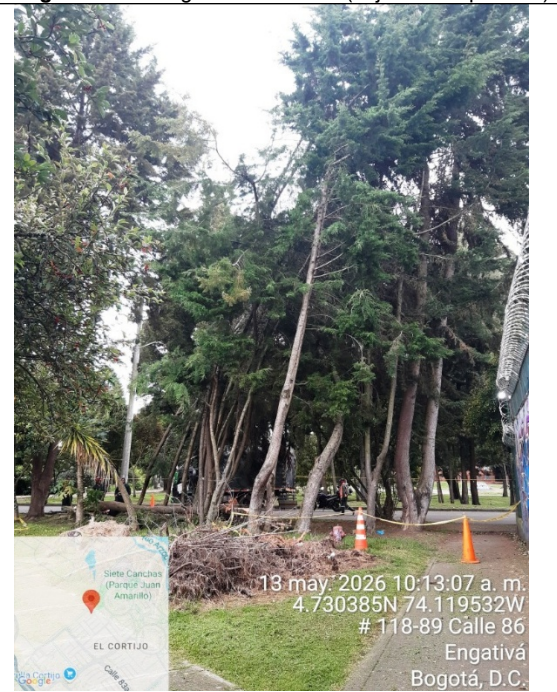
Fotografía 10. Vista general del árbol (objeto de la petición)