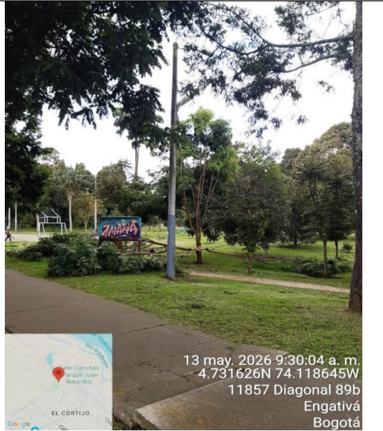
Fotografía 2. Vista general del árbol (objeto de la petición)