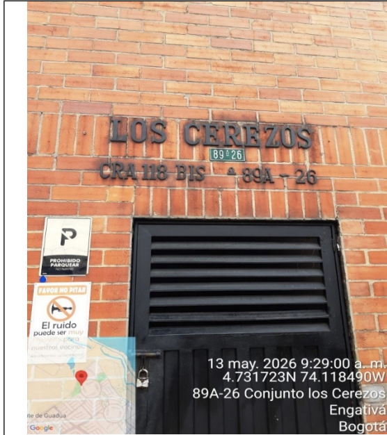
Fotografía 1. Punto de referencia (objeto de la petición)

SECRETARÍA DISTRITAL DE AMBIENTE Folios: XXXX. Anexos: XX. Radicación #: XXXXXXXXXX Proc #: XXXXXX Fecha: XXXX-XX-XX XX:XX Tercero: XXXXXXXXXX - XXXXXXXXXXXXXXXXXXXXXXXXXXXXXXXXXXXX Dep Radicadora: XXXXXXXXXXXXXXXXXXXXXXXXXXXXXXXXXXXX Clase Doc: XXXXXXXX Tipo Doc: XXXXXXXX