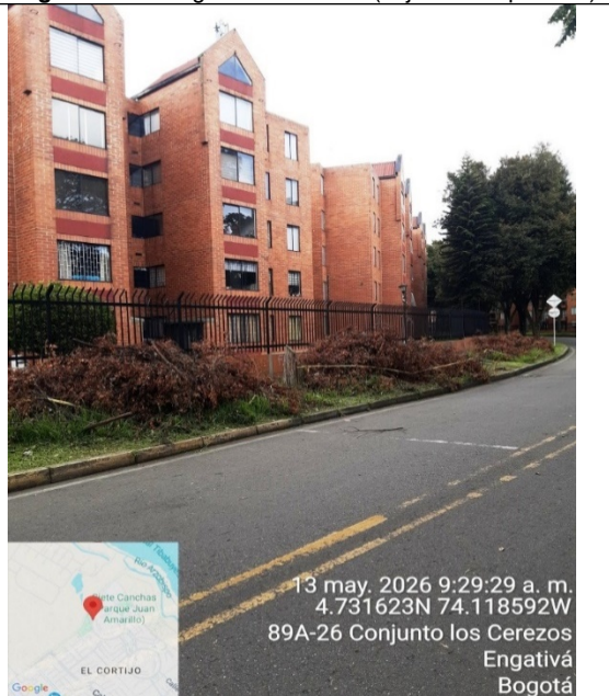
Fotografía 4. Vista general del árbol (objeto de la petición)

Secretaría Distrital de Ambiente Av. Caracas N° 54-38 PBX: 3778899 / Fax: 3778930 www.ambientebogota.gov.co Bogotá, D.C. Colombia