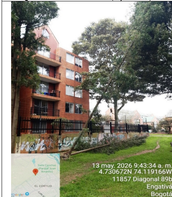
Fotografía 3. Vista general del árbol (objeto de la petición)