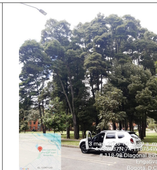
Fotografía 2. Vista general del árbol (objeto de la petición)