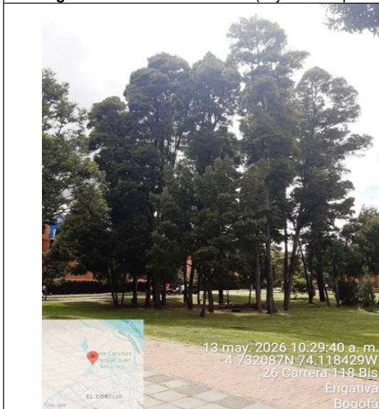
Fotografía 3. Vista general del árbol (objeto de la petición)