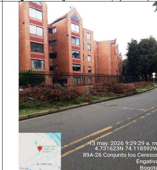
Fotografía 4. Vista general del árbol (objeto de la petición)