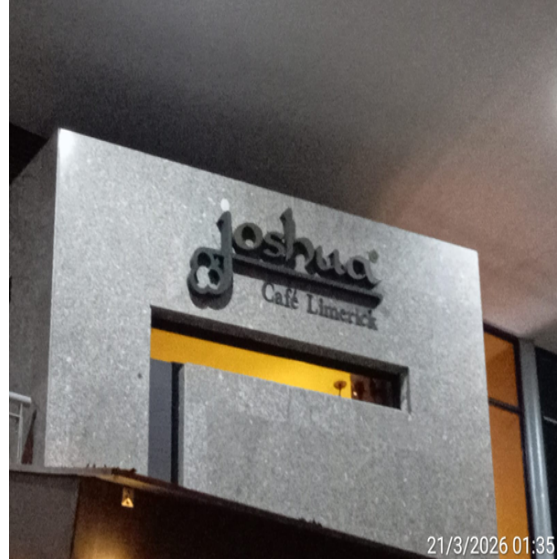
Fotografía No. 2 Nombre comercial expuesto en fachada del establecimiento.