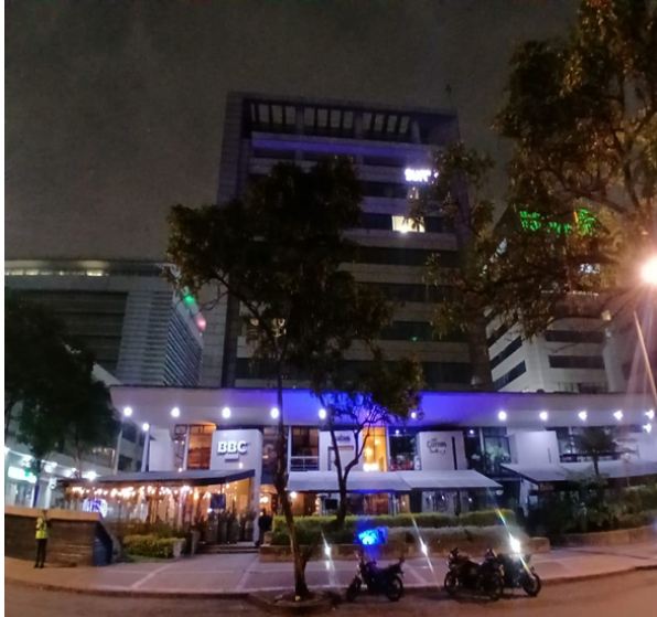
Fotografía No. 1. Vista general del predio objeto de seguimiento ubicado en la CL 25 B No. 68 B - 26.

A continuación, se presenta el registro fotográfico de la visita realizada: