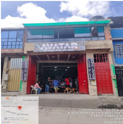
Fuente: Tomada en visita el 26/05/2026