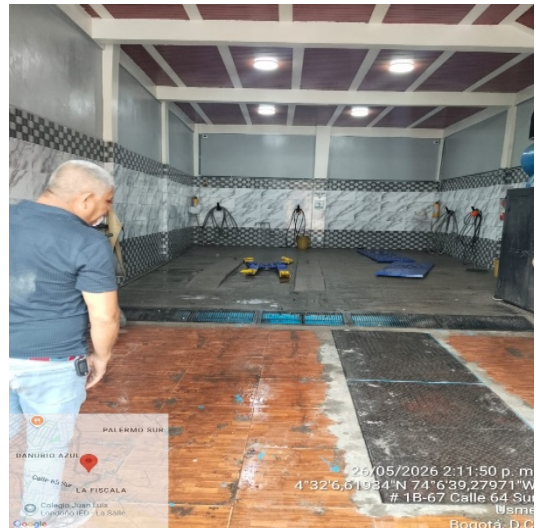
Fuente: Tomada en visita el 26/05/2026

Durante la inspección no se evidenciaron vertimientos a la calle, calzada o zonas aledañas, procedentes del establecimiento de comercio (Fotografía 3).