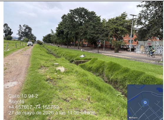
Fotografía No. 6. Flujo de cauce canal Magdalena y carreteable.