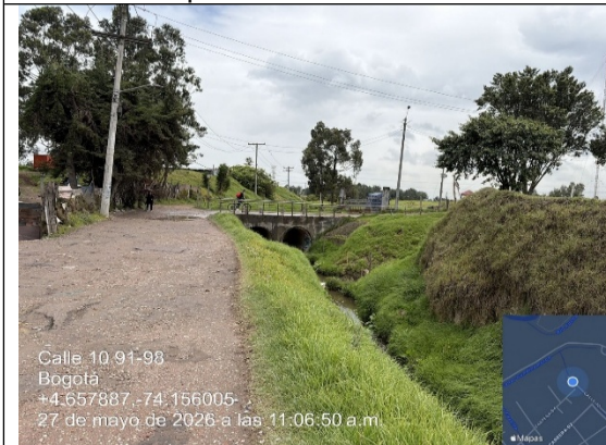
Fotografía No. 7. Vista de carreteable y puente construido en concreto, que cuenta con dos pasos de tubería de aproximadamente 60”