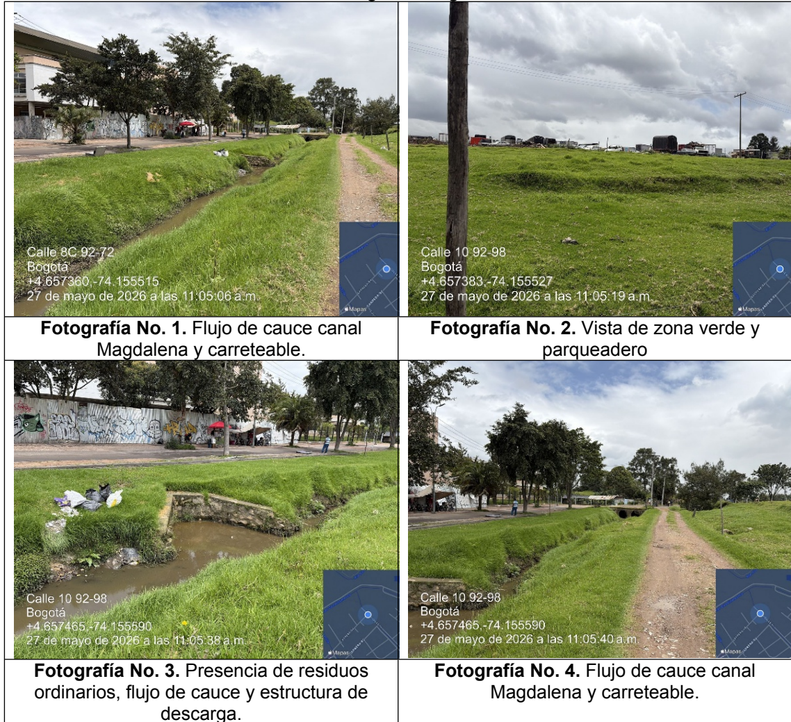
Tabla No. 1. Registro fotográfico.