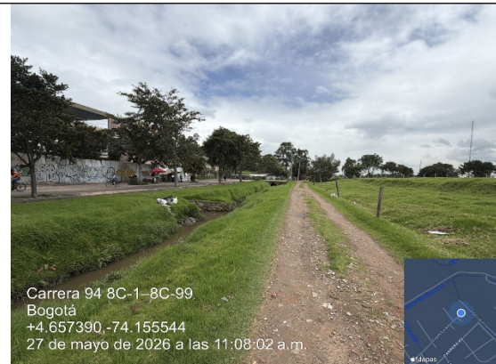
Fotografía No. 8. Flujo de cauce canal Magdalena y carreteable.