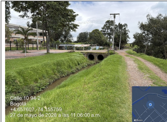
Fotografía No. 5. Vista de carreteable y puente construido en concreto, que cuenta con dos pasos de tubería de aproximadamente 60”