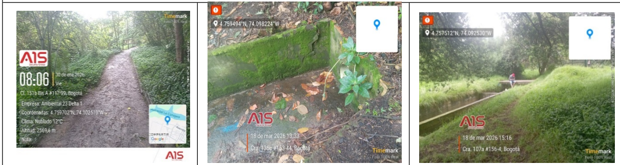
Fotografía 4, 5 y 6 Seguimiento a estructuras y estados de los senderos