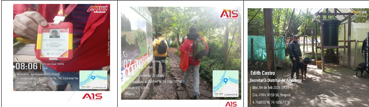
Fotografía 7. Atención a la institucionalidad