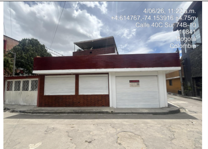
Fotografía 2. Fachada del predio