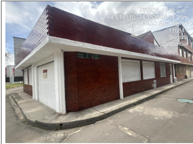
Fotografía 1. Nomenclatura del predio

SECRETARÍA DISTRITAL DE AMBIENTE Folios: XXXX. Anexos: XX. Radicación #: XXXXXXXX Proc #: XXXXXX Fecha: XXXX-XX-XX XX:XX Tercero: XXXXXXXXX - XXXXXXXXXXXXXXXXXXXXXXXXXXXXXXXX Dep Radicadora: XXXXXXXXXXXXXXXXXXXXXXXXXXXXXXXX Clase Doc: XXXXXXXX Tipo Doc: XXXXXXXX