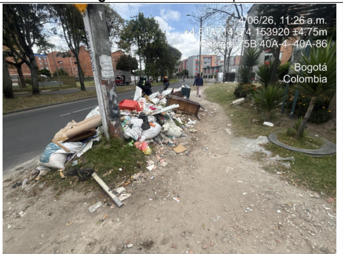
Fotografía 4. Punto crítico contigua al predio