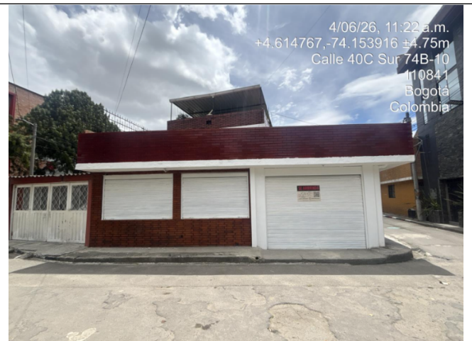
Fotografía 2. Fachada del predio