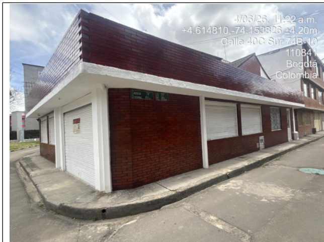
Fotografía 1. Nomenclatura del predio