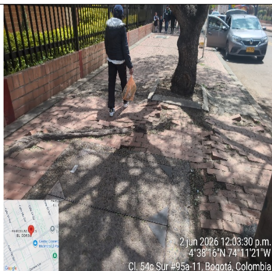
Fotografía 6: Fuste árbol 3