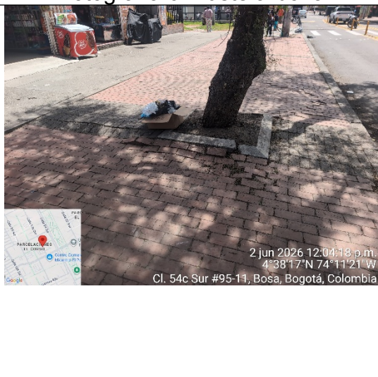
Fotografía 8: Fuste de Árbol 1