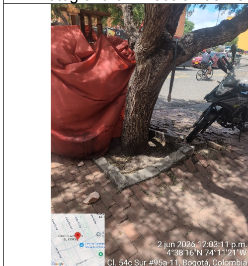
Fotografía 7: Fuste árbol 4