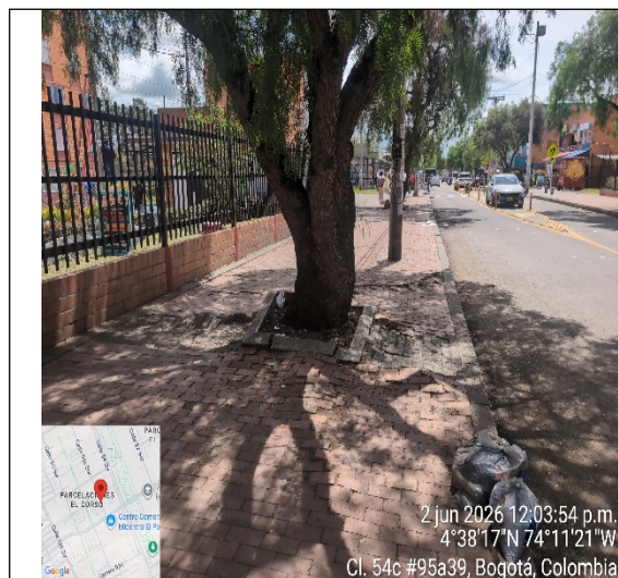
Fotografía 9: Fuste de Árbol 2