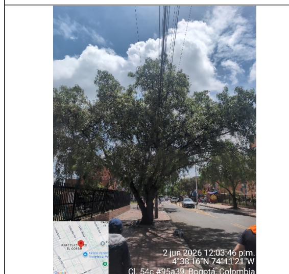
Fotografía 3: Árbol mencionado como árbol 2