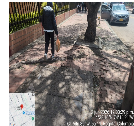
Fotografía 1: Afectaciones adoquín