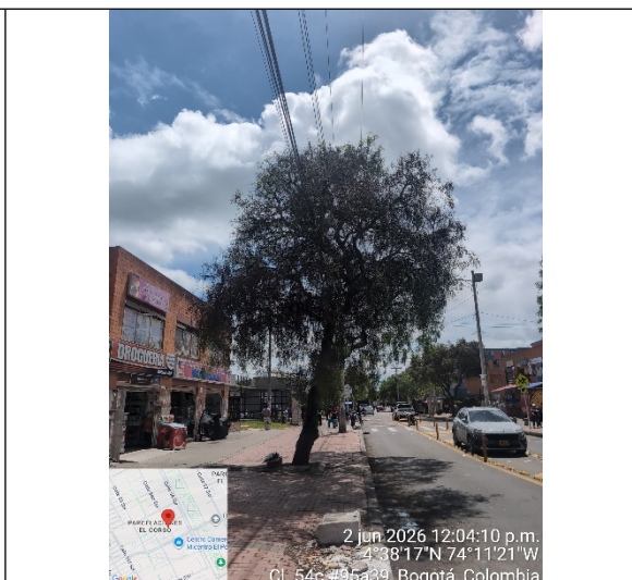
Fotografía 2: Árbol mencionado como Árbol 1