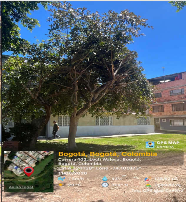
Foto 6. Vista general árbol 6 afectado