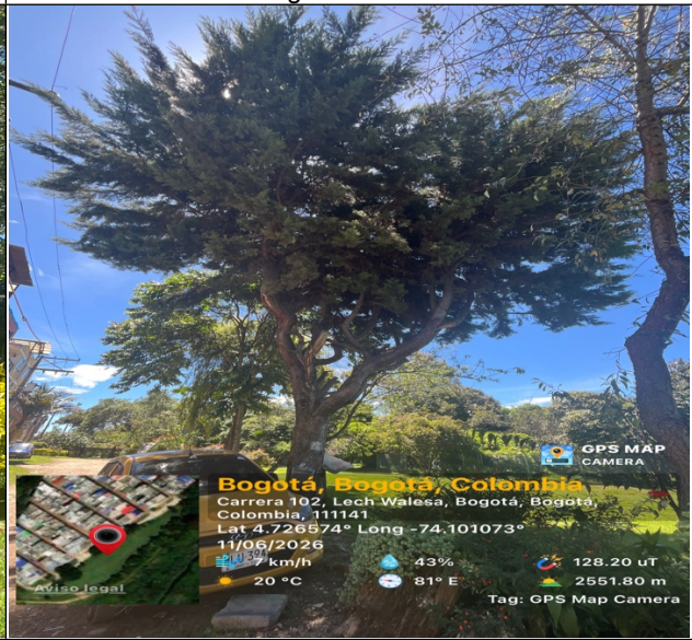
Foto 12. Vista general árbol 12 afectado

Secretaría Distrital de Ambiente Av. Caracas N° 54-38 PBX: 3778899 / Fax: 3778930 www.ambientebogota.gov.co Bogotá, D.C. Colombia