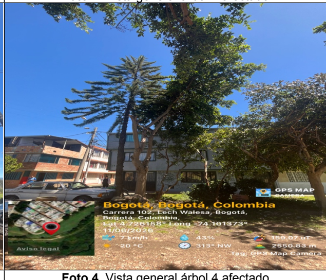
Foto 4. Vista general árbol 4 afectado