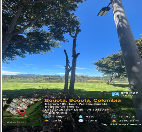
Foto 1. Vista general árbol 1 afectado