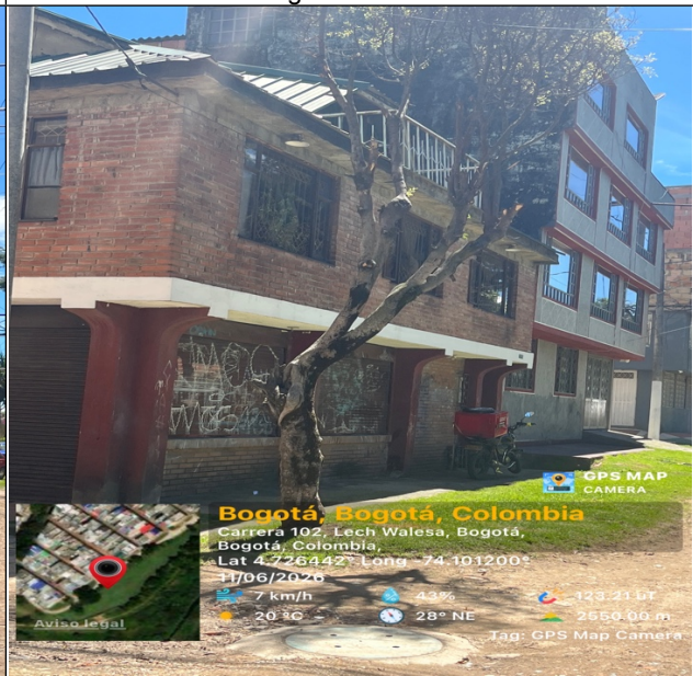
Foto 8. Vista general árbol 8 afectado

Secretaría Distrital de Ambiente Av. Caracas N° 54-38 PBX: 3778899 / Fax: 3778930 www.ambientebogota.gov.co Bogotá, D.C. Colombia