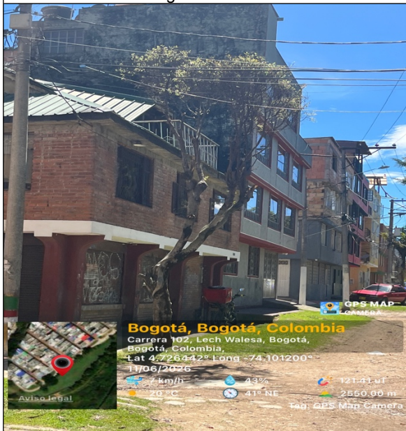
Foto 7. Vista general árbol 7 afectado