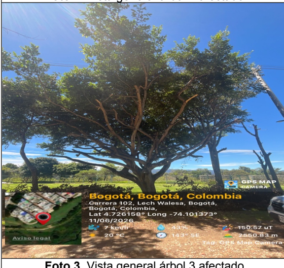
Foto 3. Vista general árbol 3 afectado