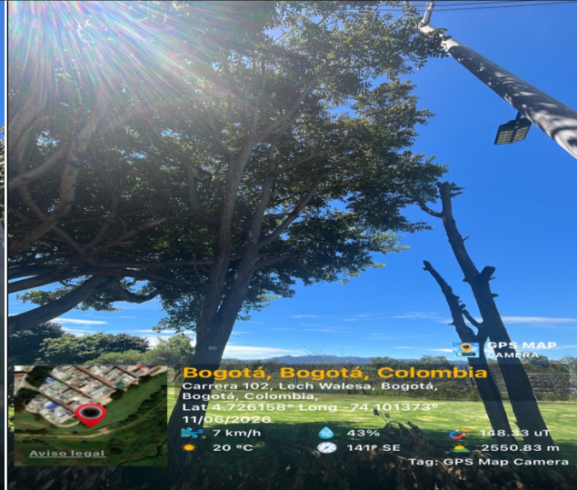
Foto 2. Vista general árbol 2 afectado