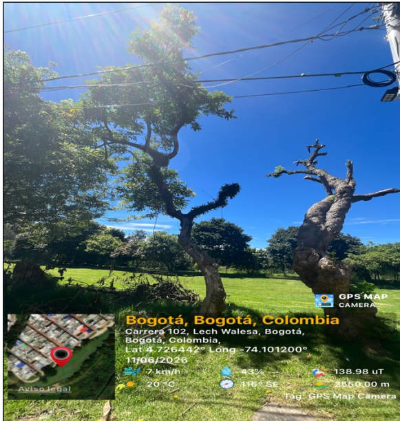
Foto 9. Vista general árbol 9 afectado

ALCALDÍA MAYOR DE BOGOTÁ D.C. SECRETARÍA DE AMBIENTE