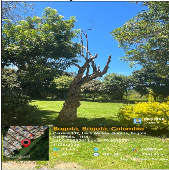
Foto 11. Vista general árbol 11 afectado