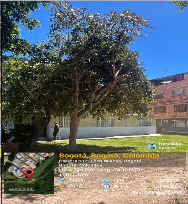
Foto 6. Vista general árbol 6 afectado