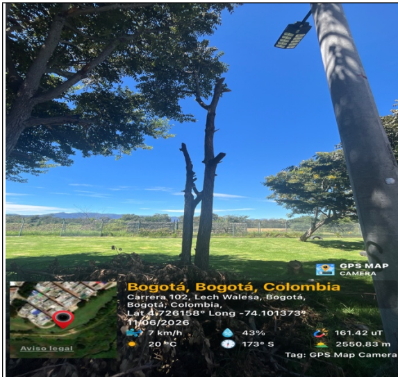
Foto 1. Vista general árbol 1 afectado