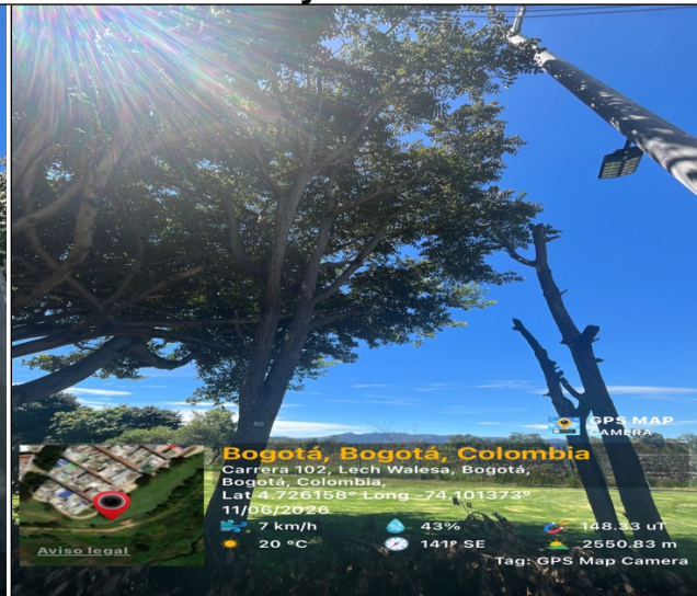
Foto 2. Vista general árbol 2 afectado