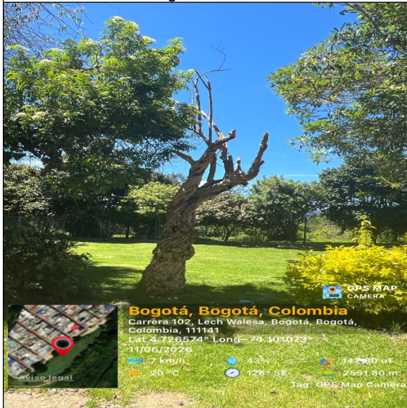
Foto 11. Vista general árbol 11 afectado