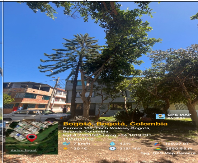
Foto 4. Vista general árbol 4 afectado