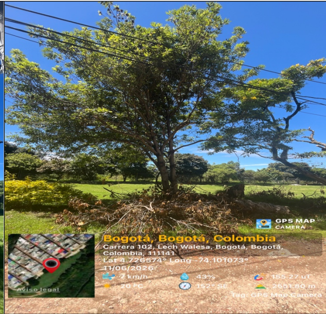
Foto 10. Vista general árbol 10 afectado