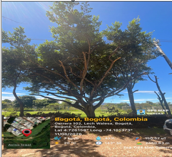
Foto 3. Vista general árbol 3 afectado