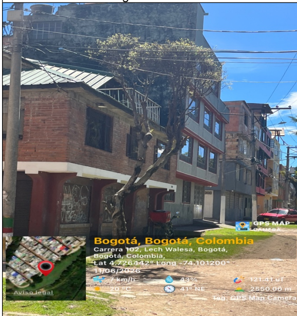
Foto 7. Vista general árbol 7 afectado