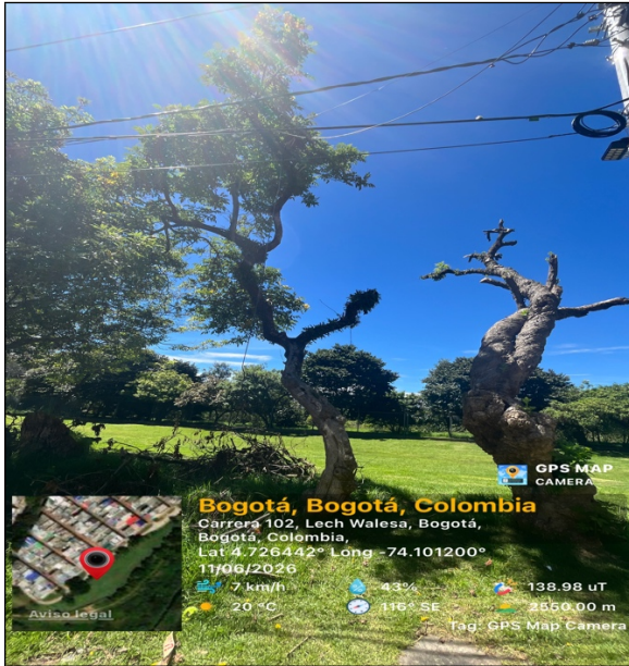
Foto 9. Vista general árbol 9 afectado