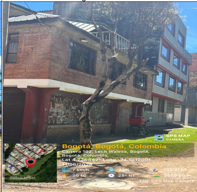
Foto 8. Vista general árbol 8 afectado