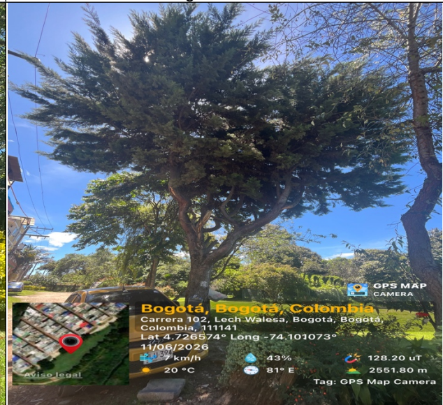
Foto 12. Vista general árbol 12 afectado