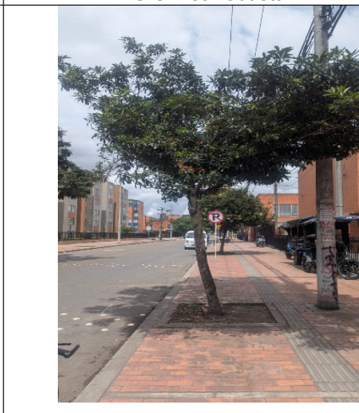
Fotografía 7: Individuo de Laurel Huesito sin fractura de ramas