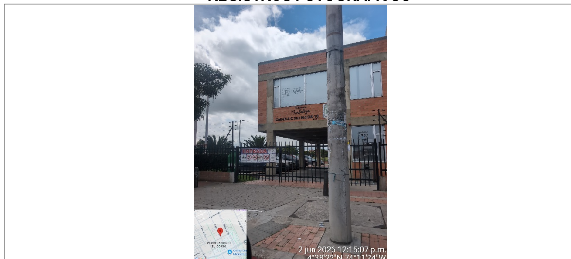
Fotografía 1: Dirección de visita