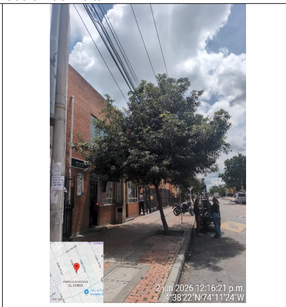
Fotografía 3: Individuo de Laurel Huesito