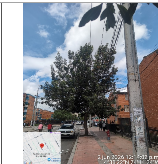
Fotografía 5: Vista general del individuo Grevillea robusta