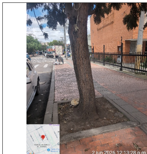
Fotografía 4: Vista fuste del individuo Grevillea robusta