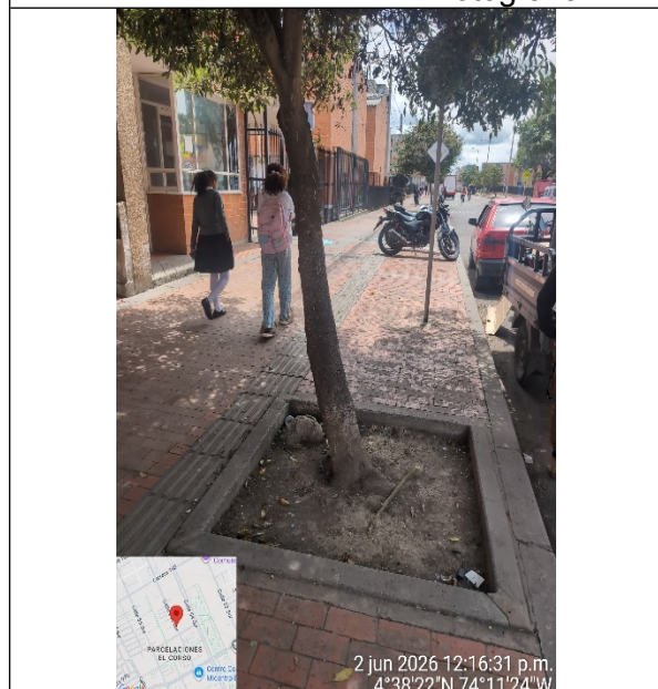
Fotografía 2: Fuste individuo de Laurel Huesito