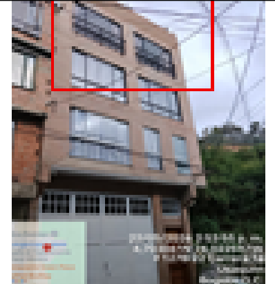
Fotografía 5. Pisos construidos y terminados en la vivienda con dirección LR 1 E 127 B 08.