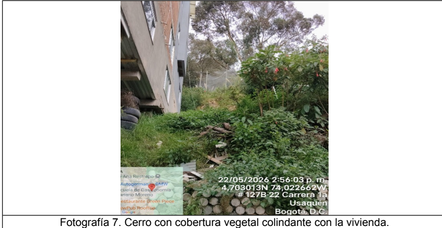
Fotografía 7. Cerro con cobertura vegetal colindante con la vivienda.

Desde la Subdirección de Recurso Suelo se analizaron los aplicativos de información geográfica como el Visor Geográfico, indicando que el predio identificado tiene la dirección KR 1 E No. 127B-08, con afectación parcial por Franja de adecuación de Cerros Orientales y parcialmente en "Zonificación de Reserva Protectora Bosque Oriental de Bogotá" (Ver imagen 1).