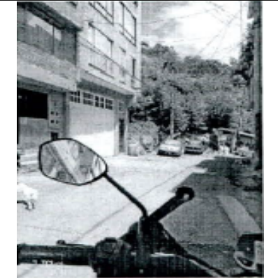
Fotografía 3. Evidencia del predio solicitado en el en el anexo del radicado 2026ER112605 del 29 de mayo de 2026.