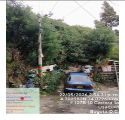
Fotografía 6. Cerro con cobertura vegetal colindante con la vivienda.