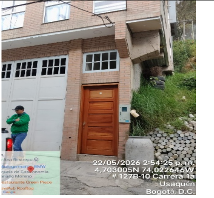
Fotografía 4. Ingreso a la vivienda, en relación con el registro fotográfico enviado (fotografía 3).