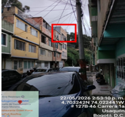
Fotografía 2. Obra construida y terminada, de acuerdo con lo evidenciado el día 22 de mayo de 2026, en visita realizada.