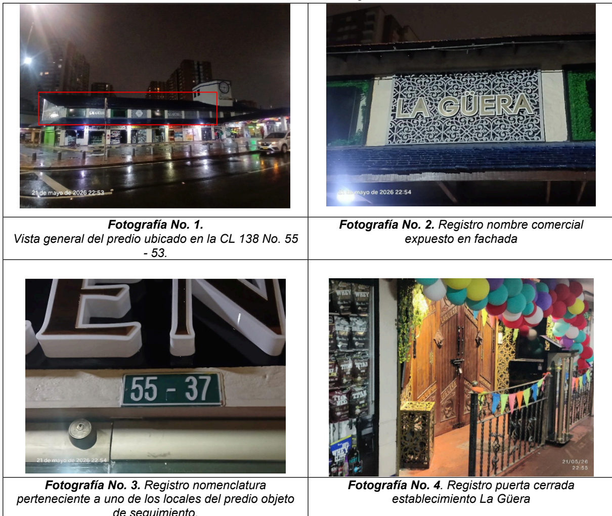
Tabla No. 1. Anexo Fotográfico