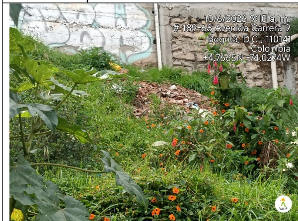
Imagen 3. Acopio de residuos de construcción y demolición en la parte central del lote.