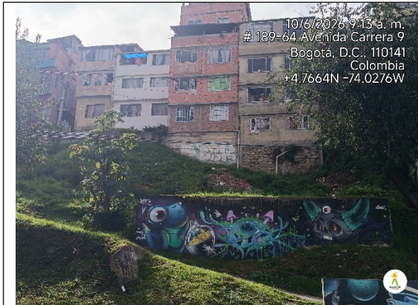
Imagen 1. Panorámica del predio donde se presentan los hechos

SECRETARÍA DISTRITAL DE AMBIENTE Folios: XXXX. Anexos: XX. Radicación #: XXXXXXXX Proc #: XXXXXX Fecha: XXXX-XX-XX XX:XX Tercero: XXXXXXXXXX - XXXXXXXXXXXXXXXXXXXXXXXXXXXXXXXXXXXX Dep Radicadora: XXXXXXXXXXXXXXXXXXXXXXXXXXXXXXXXXXXX Clase Doc: XXXXXXXX Tipo Doc: XXXXXXXX