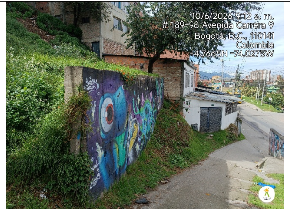
Imagen 2. Muro de contención del talud frente a las escaleras contiguo a la vivienda.