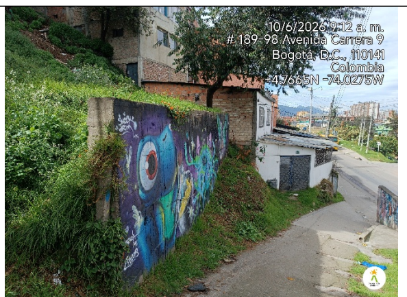
Imagen 2. Muro de contención del talud frente a las escaleras contiguo a la vivienda.