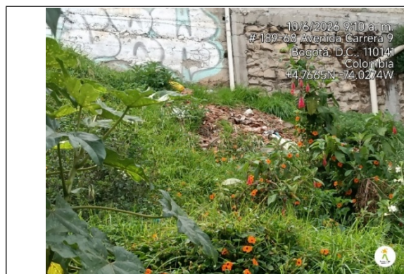
Imagen 3. Acopio de residuos de construcción y demolición en la parte central del lote.