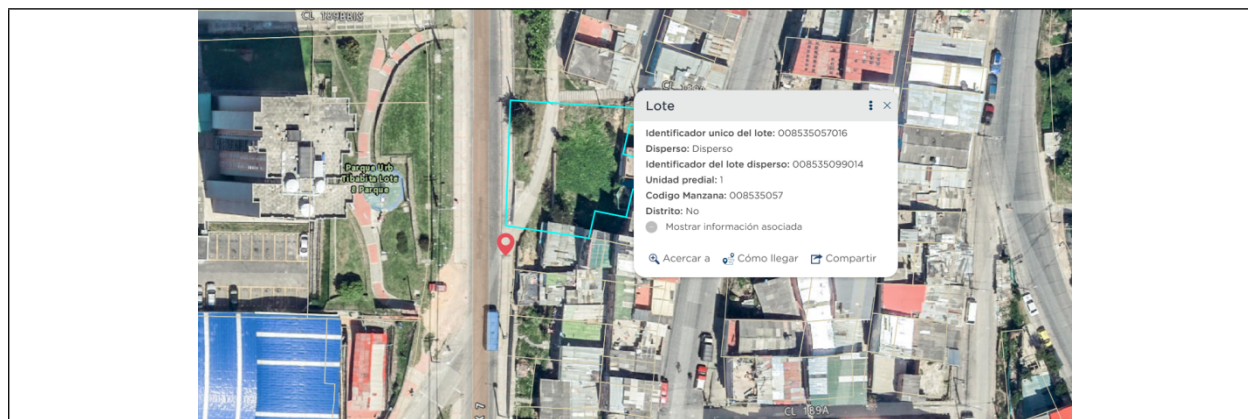
Imagen 5. Lote con identificación 008535057016 .

Así mismo, una vez georreferenciado el predio para determinar la titularidad del mismo, se pudo determinar únicamente el Identificador del lote correspondiente a 008535057016 . No obstante, este no registra titularidad o responsabilidad sobre algún particular o Entidad, que determine los requerimientos sobre el manejo de estos residuos, como se muestra a continuación: