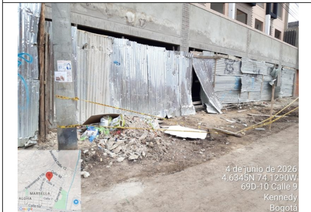
Foto 3. Vista general #1 del deterioro a zona verde de espacio público del costado oriental de la dirección y escombros.