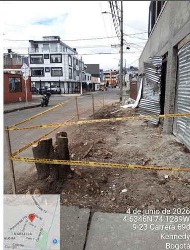
Foto 7. Vista general #3 del deterioro a zona verde de espacio público del costado oriental de la dirección.