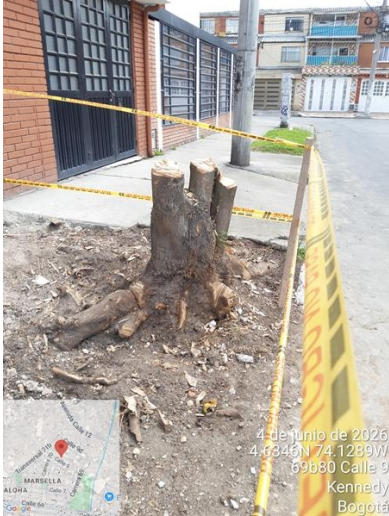
Foto 5. Vista general de árbol de urapán en espacio público con intervención.

ALCALDÍA MAYOR DE BOGOTÁ D.C. SECRETARÍA DE AMBIENTE