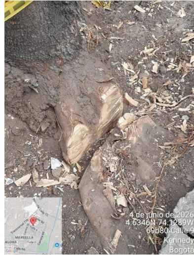
Foto 6. Vista detalle de árbol de urapán en espacio público con intervención antitécnica.