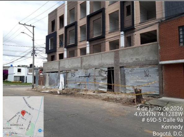
Foto 10. Vista general estado actual de espacio público del costado oriental de la dirección.