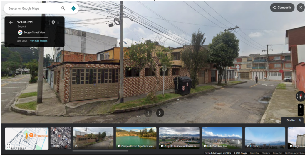
Imagen 1. Vista del estado de la zona verde y el arbolado urbano existente en abril de 2025.