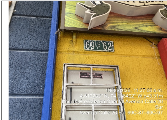
Nomenclatura urbana del predio donde se ubica el establecimiento comercial denunciado en la AC 26 SUR NO. 69 C – 62 de la localidad de Kennedy.

SECRETARÍA DISTRITAL DE AMBIENTE Folios: XXXX. Anexos: XX. Radicación #: XXXXXXXX Proc #: XXXXXX Fecha: XXXX-XX-XX XX:XX Tercero: XXXXXXXXXX - XXXXXXXXXXXXXXXXXXXXXXXXXXXXXXXX Dep Radicadora: XXXXXXXXXXXXXXXXXXXXXXXXXXXXXXXX Clase Doc: XXXXXXXX Tipo Doc: XXXXXXXX