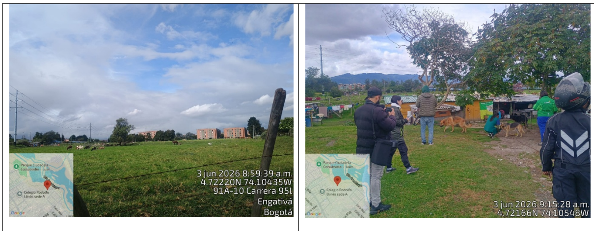
Foto 1 y 2. Recorrido entre la SDA e IDPYBA en puntos identificados con presencia de semovientes en el límite legal de la RDHJAT

Estas actuaciones se enmarcan en los principios de coordinación, concurrencia y colaboración entre autoridades distritales, orientados a la protección de la integridad ecológica del área protegida, la prevención de afectaciones ambientales y la promoción de medidas que contribuyan al adecuado manejo de los animales involucrados y a la mitigación de los riesgos asociados a su permanencia en el sector.