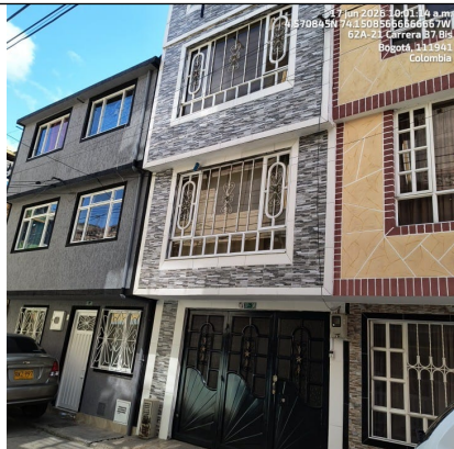
Imagen 5: Fachada del predio

Imagen 4: Se observa vivienda de 3 pisos de la Calle 62B Sur # 37-38