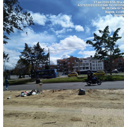
Imagen 3: Se identifica predio donde presuntamente salieron los residuos.

Imagen 2: No se observa acumulación de lonas como las registradas en el video adjunto a la solicitud, debido a las labores de limpieza y del operador de aseo.