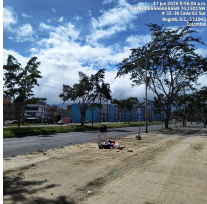
Imagen 2: No se observa acumulación de lonas como las registradas en el video adjunto a la solicitud, debido a las labores de limpieza y del operador de aseo.

Imagen 1: Inicio de la visita de verificación. Se identifica el punto señalado en el requerimiento ciudadano, donde previamente se realizó disposición inadecuada de residuos de construcción y demolición (RCD). Se observa que el sector fue objeto de recolección y limpieza; no obstante, persiste la presencia de residuos ordinarios en el espacio público.