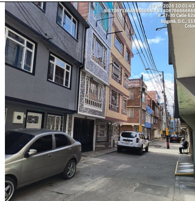
Imagen 6: Espacio público en cercanías al predio limpio y sin acumulación o evidencia de RCD en el entorno.