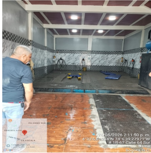
Fuente: Tomada en visita el 26/05/2026