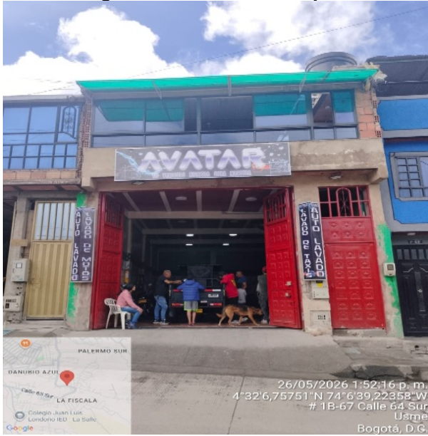
Fuente: Tomada en visita el 26/05/2026