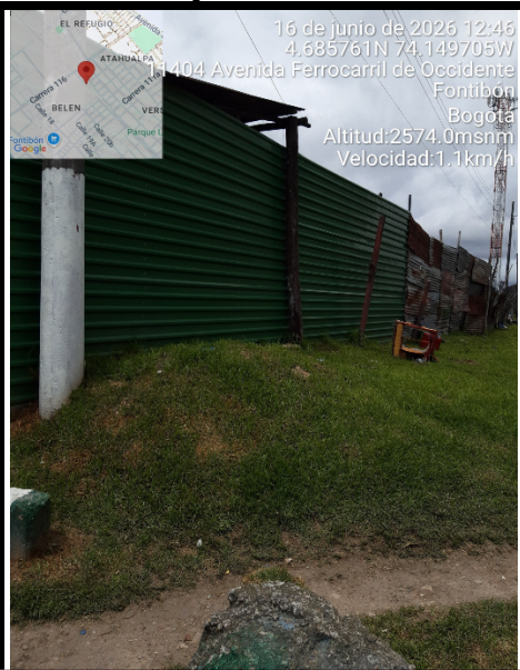
Foto 2. Vista general del espacio