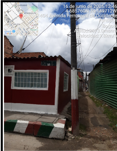
Foto 1. Detalle de la dirección