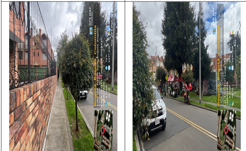
Foto 3. Vista General Arbolado encontrado