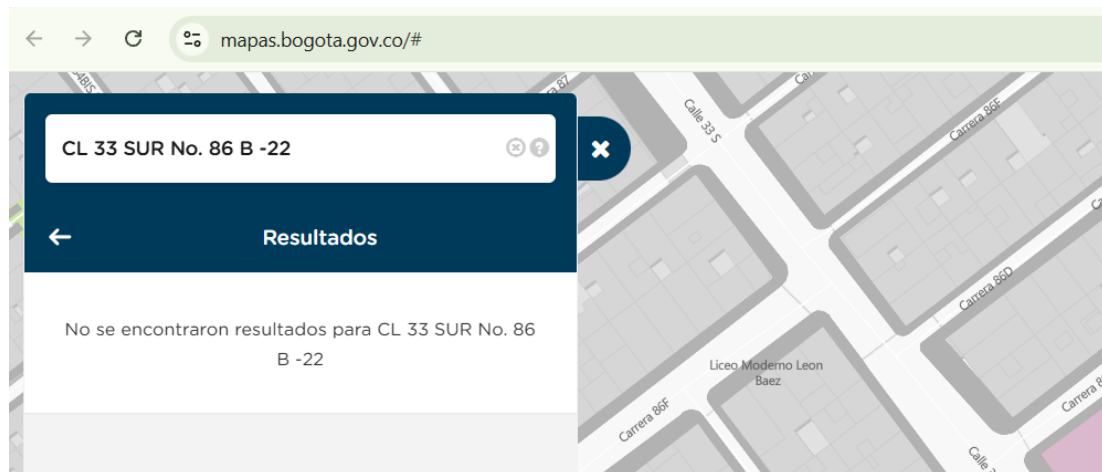
Imagen No. 1. Registro de búsqueda de la nomenclatura CL 33 SUR No. 86 B -22

En primer lugar, al realizar la búsqueda de la dirección suministrada en la herramienta Distrital llamada: MAPAS BOGOTÁ, de la Infraestructura de Datos Espaciales para el Distrito Capital (IDECA), y en las herramientas disponibles de mapas interactivos disponibles en la web (Lupap), se evidenció que la dirección reportada no pudo ser identificada como una nomenclatura asignada por la Unidad Administrativa Especial de Catastro Distrital (UAECD), tal como se evidencia en las siguientes imágenes: