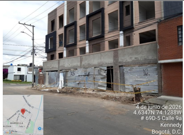
Foto 10. Vista general estado actual de espacio público del costado oriental de la dirección.