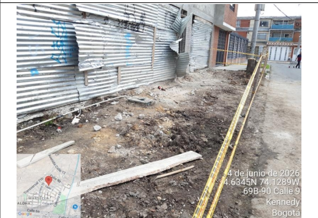
Foto 3. Vista general #1 del deterioro a zona verde de espacio público del costado oriental de la dirección y arroj de escombros.

4 de junio de 2026 4.6345N 74.1289W 69B-90 Calle 9 Kennedy Bogotá