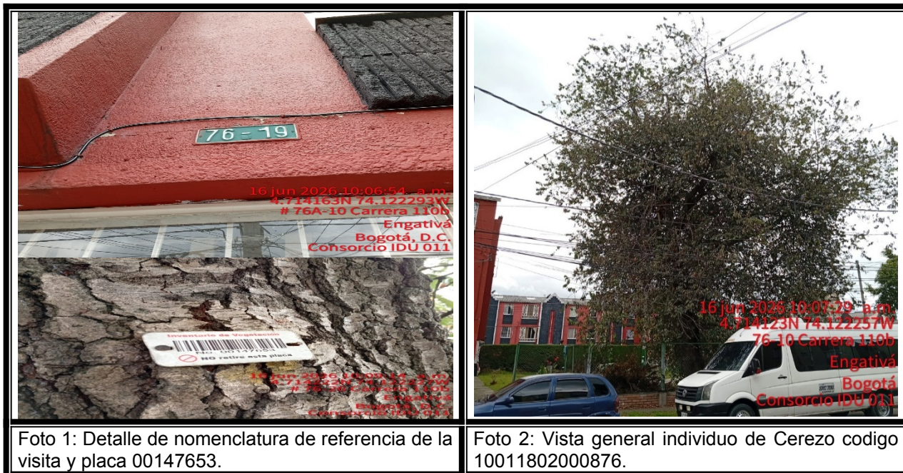
Foto 1: Detalle de nomenclatura de referencia de la visita y placa 00147653.