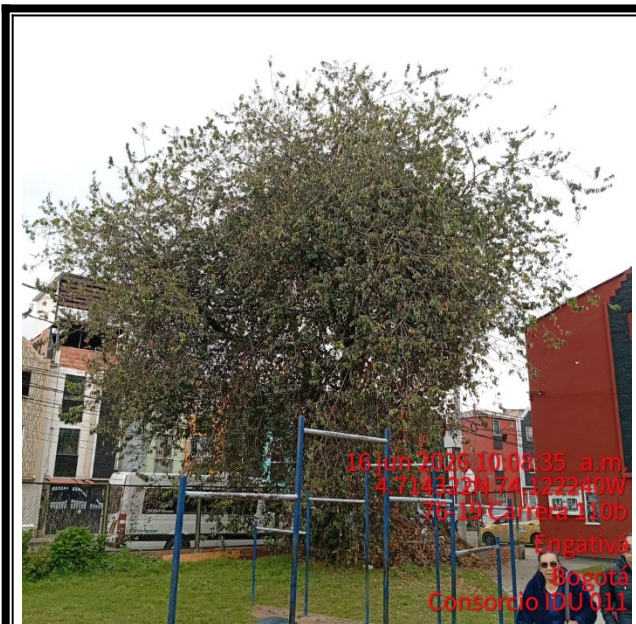
Foto 3: Vista general individuo de Cerezo código 10011802000876.