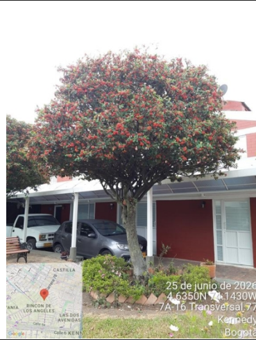
Foto 12. Vista general arbusto de holly liso #6 con intervención antitécnica.