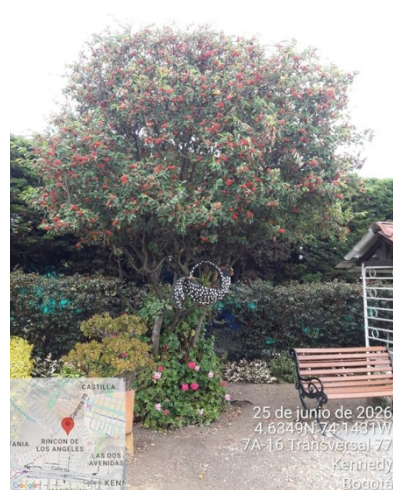
Foto 8. Vista general árbol de holly liso #2 con intervención de poda.