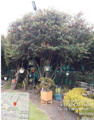
Foto 7. Vista general árbol de holly liso #1 con intervención de poda.