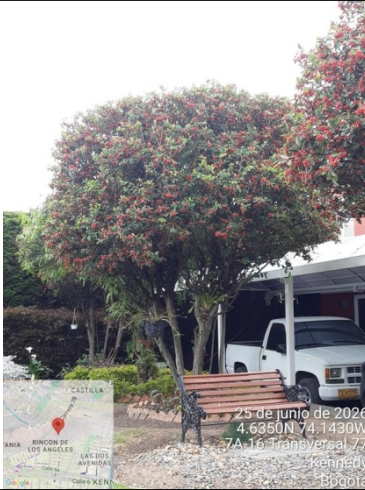
Foto 11. Vista detalle arbusto de holly liso #5 con intervención antitécnica.