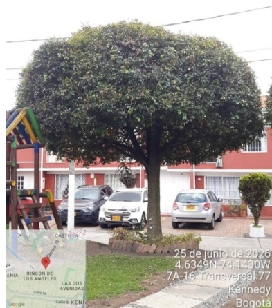
Foto 3. Vista general árbol de eugenia #2 con intervención de poda.