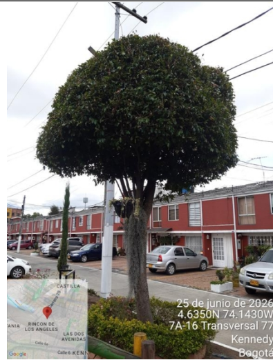
Foto 2. Vista general árbol de eugenia #1 con intervención de poda.