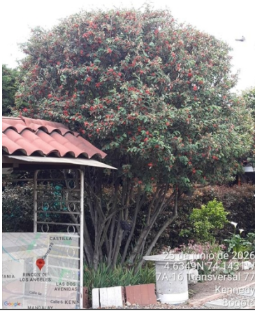
Foto 9. Vista general árbol de holly liso #3 con intervención de poda.

ALCALDÍA MAYOR DE BOGOTÁ D.C. SECRETARÍA DE AMBIENTE