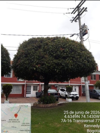
Foto 5. Vista general árbol de eugenia #4 con intervención de poda.

ALCALDÍA MAYOR DE BOGOTÁ D.C. SECRETARÍA DE AMBIENTE