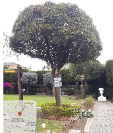
Foto 4. Vista general árbol de eugenia #3 con intervención de poda.