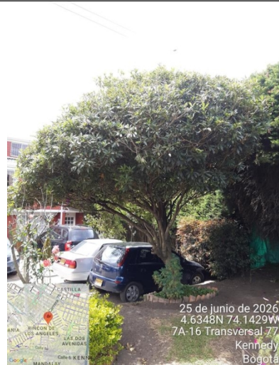
Foto 6. Vista general árbol de jazmín del cabo con intervención de poda.