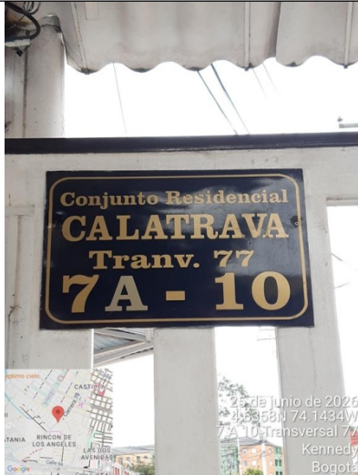
Foto 1. Placa de ubicación de la visita.