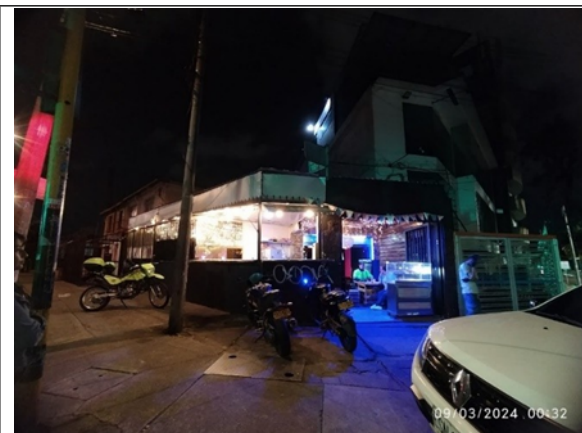
Fotografía No. 1. Vista general del predio objeto de seguimiento.

A continuación, se presenta registro fotográfico obtenido durante la visita: