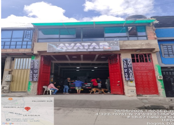
Fotografía 1. Fachada del predio