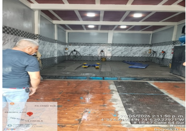
Fotografía 2. Área de lavado de vehículos