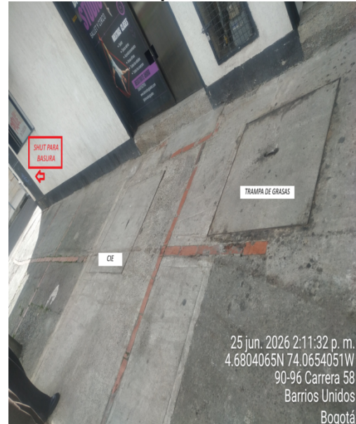
Fotografía 4. Trampa de grasa y Caja de inspección