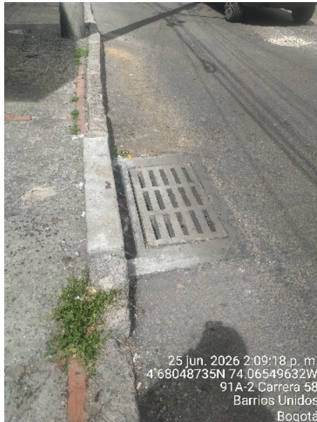
Fotografía 3. Alrededores sin vertimientos ni afectaciones visibles al alcantarillado

Durante el recorrido técnico y la verificación del área aledaña al establecimiento, no se observaron indicios ni evidencias de vertimientos de Aguas Residuales sobre el espacio público, ni afectaciones o rebosamientos visibles en el sistema de alcantarillado local. De igual manera, el día de la visita no se percibieron olores molestos provenientes de la trampa de grasa externa ni de la actividad productiva (ver Fotografías 3 y 4).