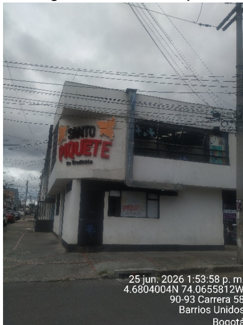
Fotografía 1. Fachada del predio

25 jun. 2026 1:53:58 p. m. 4.6804004N 74.0655812W 90-93 Carrera 58 Barrios Unidos Bogotá