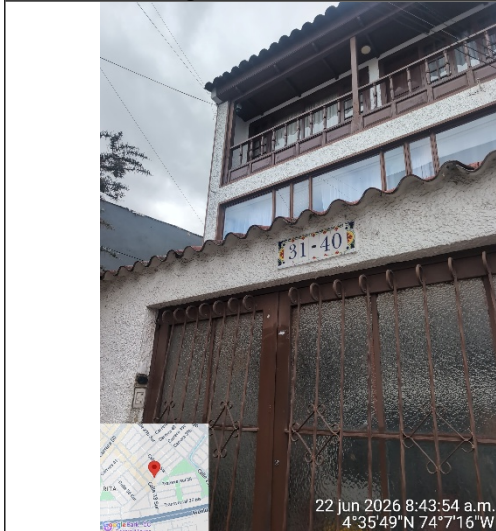
Fotografía 3: Dirección de visita