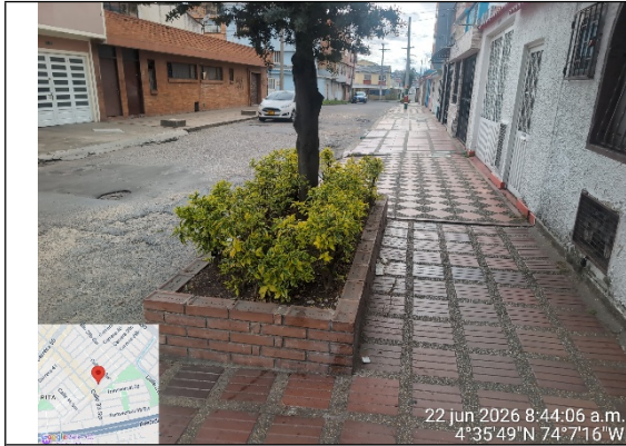
Fotografía 1: Anden aledaño