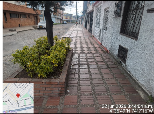
Fotografía 2: Anden aledaño