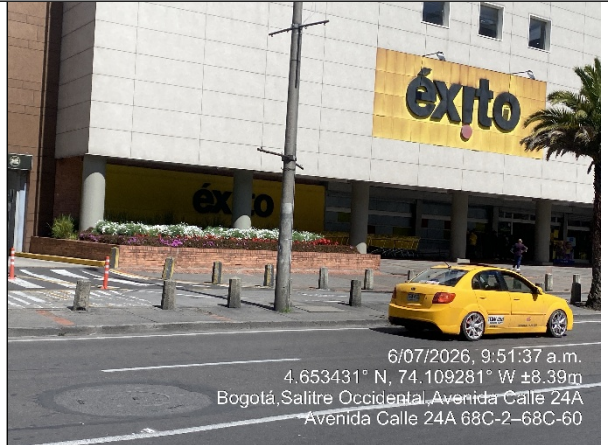
Vista panorámica del sector denunciado Fotografía No. 7