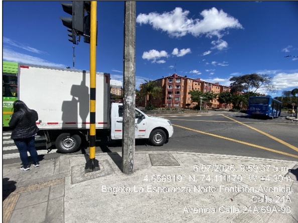
Vista panorámica del sector denunciado

SECRETARÍA DISTRITAL DE AMBIENTE Folios: XXXX. Anexos: XX. Radicación #: XXXXXXXX Proc #: XXXXXX Fecha: XXXX-XX-XX XX:XX Tercero: XXXXXXXXXX - XXXXXXXXXXXXXXXXXXXXXXXXXXXXXXXX Dep Radicadora: XXXXXXXXXXXXXXXXXXXXXXXXXXXXXXXX Clase Doc: XXXXXXXX Tipo Doc: XXXXXXXX