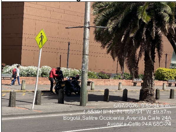
Vista panorámica del sector denunciado Fotografía No. 8