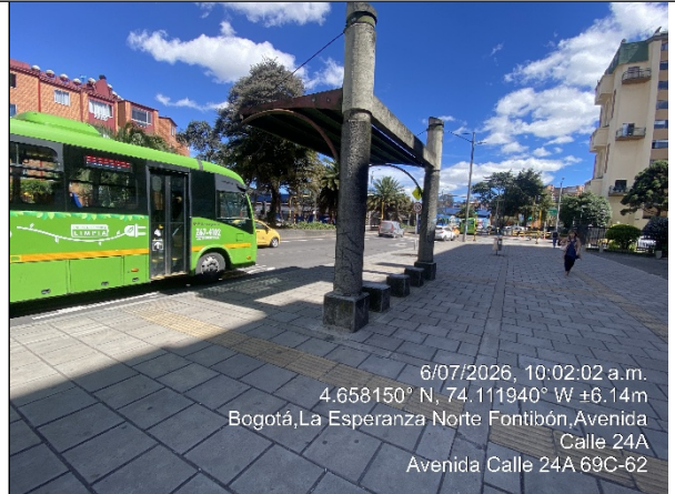
Vista panorámica del sector denunciado

Teniendo en cuenta lo observado y presentado en el registro fotográfico anterior, no se evidenció ningún comportamiento que vaya en contravía del marco normativo ambiental vigente en cuanto a Publicidad Exterior Visual, así como tampoco los elementos publicitarios denunciados.