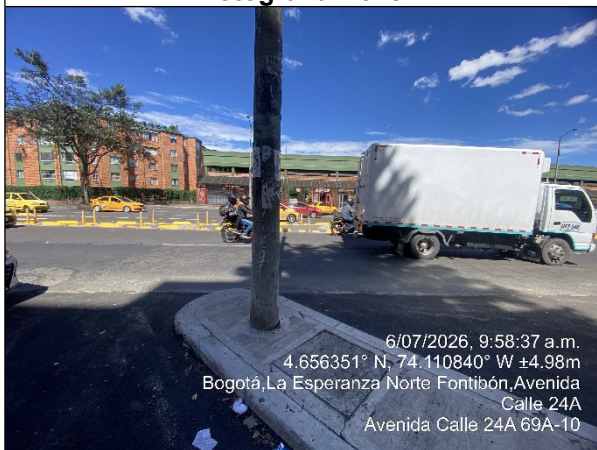
Vista panorámica del sector denunciado Fotografía No. 10