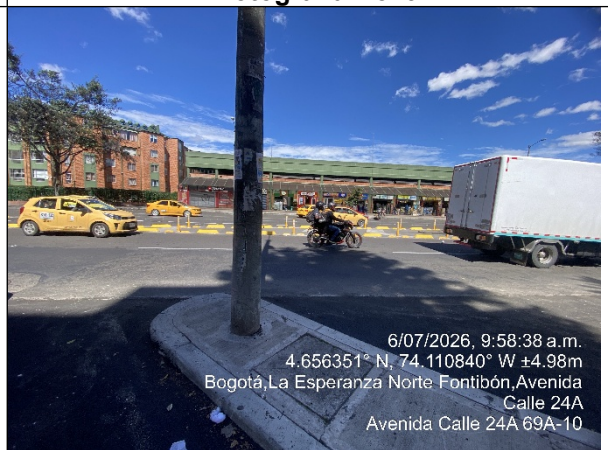
Vista panorámica del sector denunciado Fotografía No. 11

Secretaría Distrital de Ambiente Av. Caracas N° 54-38 PBX: 3778899 / Fax: 3778930 www.ambientebogota.gov.co Bogotá, D.C. Colombia