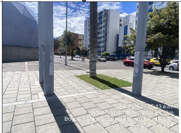
Vista panorámica del sector denunciado Fotografía No. 9