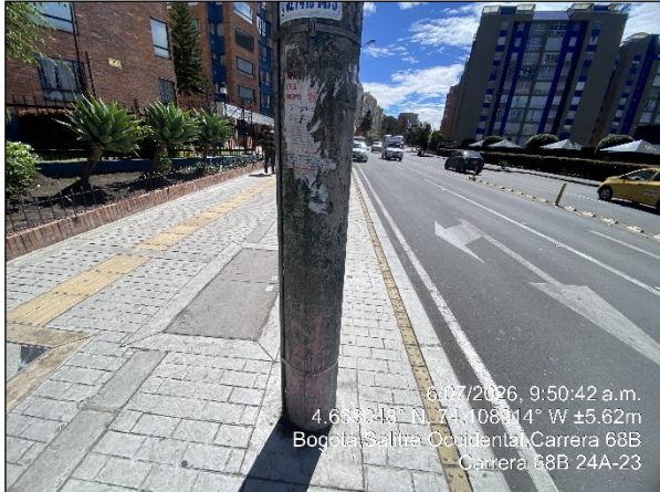
Vista panorámica del sector denunciado Fotografía No. 6

SECRETARÍA DISTRITAL DE AMBIENTE Folios: XXXX. Anexos: XX. Radicación #: XXXXXXXX Proc #: XXXXXX Fecha: XXXX-XX-XX XX:XX Tercero: XXXXXXXXXX - XXXXXXXXXXXXXXXXXXXXXXXXXXXXXXXX Dep Radicadora: XXXXXXXXXXXXXXXXXXXXXXXXXXXXXXXX Clase Doc: XXXXXXXX Tipo Doc: XXXXXXXX