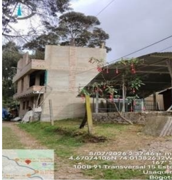
Fotografía 3. Perfil de la edificación con 2 plantas construidas y una 3 en obra.

De igual manera, se realizó un recorrido por el sector, encontrando que existen otras viviendas construidas, las calles consisten en vías compactadas con maquinaria. La vivienda objeto de visita se encuentra ubicada en la Ronda Hídrica de la Quebrada Morací y de la Quebrada Quebradita y parcialmente en la Franja de Adecuación de Cerros Orientales. (Ver imagen 1)